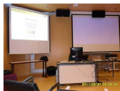
School of Art, Music and Media - Finlayson